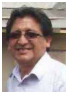
Por FRANCISCO JAUREGUI

A poco más de un año del inicio de actividades del Consulado General del Perú en Phoenix (CGPP), la comunidad peruana en Arizona se prepara para elegir a los integrantes del Consejo de Consulta 2025-2026, un mecanismo de participación ciudadana que busca fortalecer los vínculos entre el Consulado y sus connacionales.